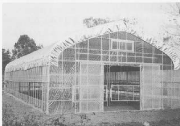
パイプハウス牛舎の例

地域の肉用牛振興を図るために独創的な取り組みを提案してください。新潟県の生産基盤条件の中で肉用牛の生産拡大につながるような新たな活動を考えていましたら当協会又は県の地域振興事務所にぜひご相談ください。